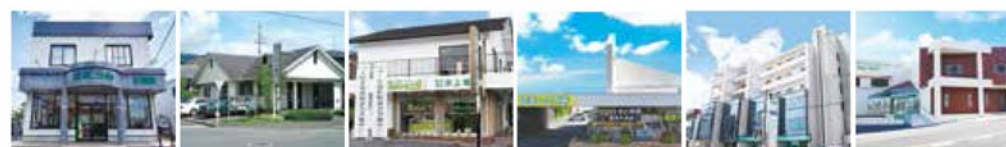
【(株)井上地所/岩出店】 【(株)井上地所/五條本店】 【(株)井上地所/吉野店】 【(株)井上地所/奈良中央店】 【(株)井上地所/橋本店】 【(株)井上地所/五條支店】 ※吉野店は工務部のみです。